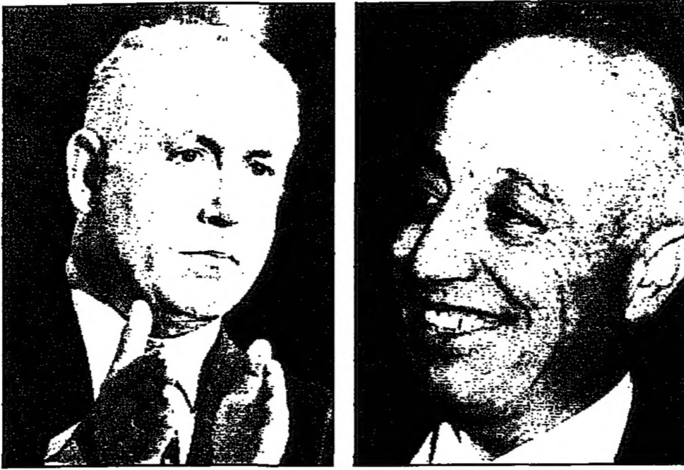
احمد قريع (يسار) وبنيامين نتانياهو (يمين)